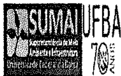
image001.png 64 KB