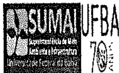
image001.png 64 KB

Emprotec Engenharia Danilo Silva (84) 3012-6811