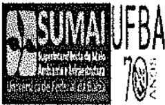
image002.png 64 KB