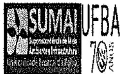
image001.png 64 KB