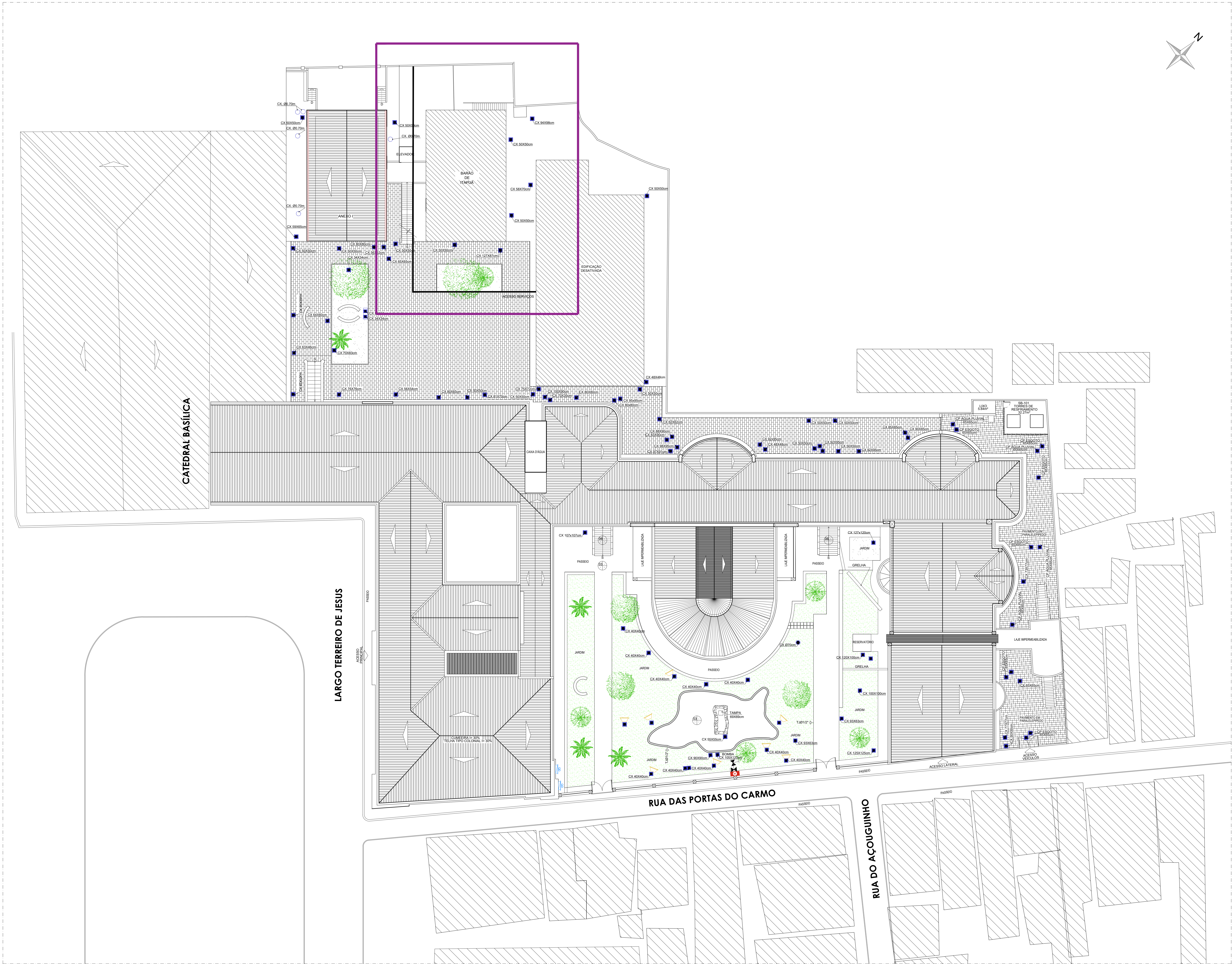
01 PLANTA DE SITUAÇÃO ESCALA 1:200